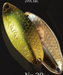
No.39 フレッシュメント