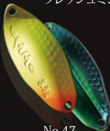
No.47 カナブンチャート