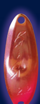
NO.11 スパークリングオレンジ