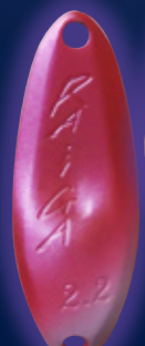
NO.7 スパークリングピンク