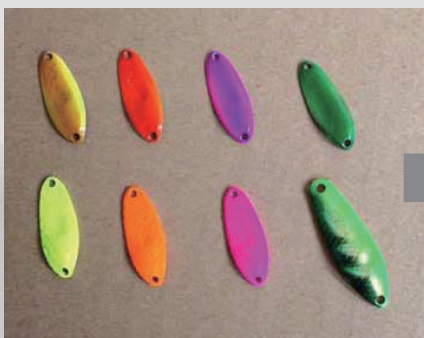
上段が「透過カラー2015」 下段が通常蛍光カラー